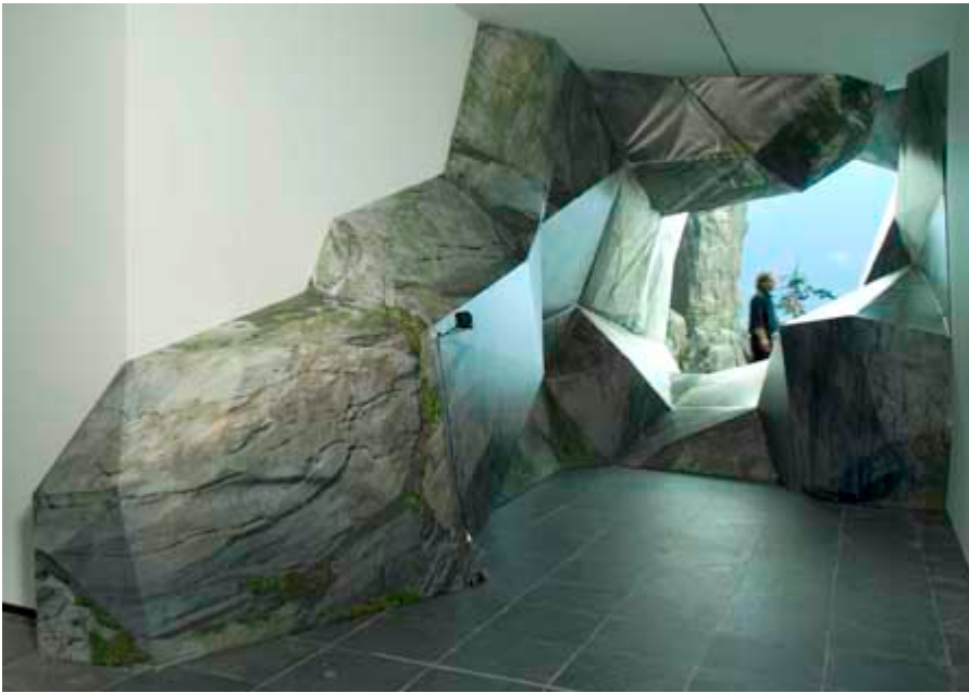
Monica Studer en Christoph van den Berg, 'Loch' (2009)

De inzichten en theoretische achtergronden die aan Beyond the Picturesque ten grondslag liggen, worden toegelicht in een begeleidende publicatie die men niet zonder meer kan loskoppelen van de tentoonstelling zelf. Integendeel: dit heldere en fraaie boekwerk loodst ons als een onvervalste Baedeker door het project, met toegankelijke toelichting bij de getoonde werken en met name een bijzonder goed gedocumenteerd en bevattelijk essay van curator Jacobs over de manier waarop herfotografie een centraal gegeven is in zowel deze tentoonstelling als in de dynamiek van de hedendaagse fotografische praktijk. Boek en tentoonstelling vormen samen een aantrekkelijk en verrijkend pakket. In een wereld waar prestigieuze catalogi al te vaak aanleiding zijn tot breedsprakerig obscurantisme mag ook dat al eens worden benadrukt.