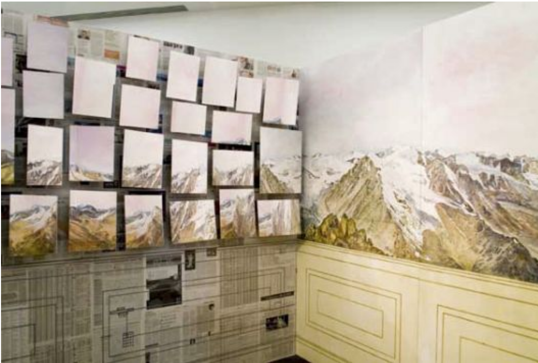
Ellen Harvey, 'The Room of Sublime Wallpaper (I)' (2008)

dat het Citadelpark, naast zijn pittoreske aanleg met faux-rotsformaties, als ontmoetingsplaats voor homo-mannen ook nog een andere gebruiksmodus kent voor mensen op zoek naar verborgen hoekjes en kantjes).