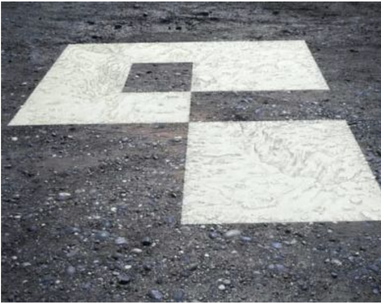
John Timberlake, 'Colony 14' (2006)

Veruit één van de interessantste kunstenaars die in Beyond the Picturesque te zien is, is John Timberlake, die verschillende varianten biedt op het romantisch-pittoreske landschap. In de reeks Another Country , waarvan één werk te zien is, maakt hij foto's van plastic figuurtjes die voor schilderijen van apocalyptische landschappen zijn geplaatst. Colony 13 en Colony 14 (beide 2006) zijn digitaal geprinte foto's van kiezelvlakken waar stukken uit zijn weggesneden. In die vlakken tekende Timberlake naadloos op de foto aansluitende grachten, steengroeven en berglandschappen. Tenslotte wordt ook een selectie getoond uit zijn reeks Google Paintings , waar hij sinds 2007 aan werkt en die beelden ontleent aan het Google-project om heel de wereld fotografisch in beeld te brengen, tot bewegende opnames van alle straten ter wereld toe. Hier biedt zijn werk trouwens een leuke link met het werk van Jussi Kivi, die onder meer probeert landschapskaarten te reconstrueren van de exacte locatie waar Caspar David Friedrich één van zijn beroemde berglandschappen schilderde.