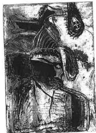
DAN ZBARCEA (ルーマニア) 126 SOLITUDE 37 × 25 銅版