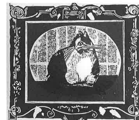
LUCIAN DOREL NAN (ルーマニア) 152 Pisica (Cat) 63 × 56 リノカット