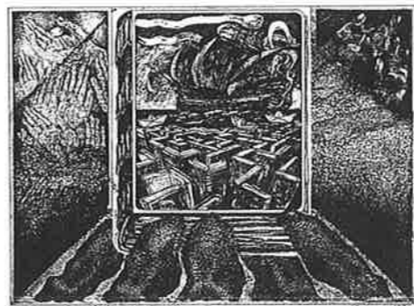
ADRIAN SELEGEAN (ルーマニア) 144 HOPE 18 × 24.5 銅版