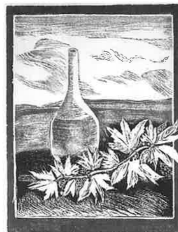
JENNY MARKAKI (ギリシャ) 147 Still life in landscape 64.5 × 50 木版