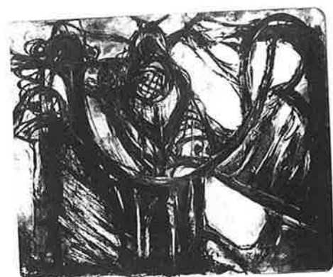
MIHAIL VOICU (ルーマニア) 129 Nucleus 28.5 × 23.5 石版