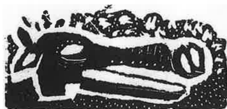
STEPHEN MUMBERSON (イギリス) 139 Mask 3 × 6 木版