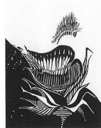
ARIA COMIANOU (ギリシャ) 145 COMPOSITION No.346 24 × 30 木版