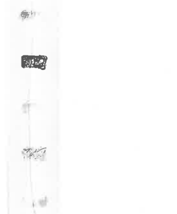
TIMAR ADRIAN (ルーマニア) 141 I LITO TO RED LINE 100 × 23 石版