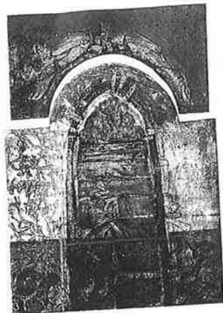
DOINA MISIAN (ルーマニア) 125 TRECEREA II... 47.5 × 68 コログラフ