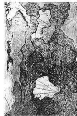
VALLE LÓPEZ HERUÁÑEZ (ベネズエラ) 17 IMAGENES 15×10 銅版