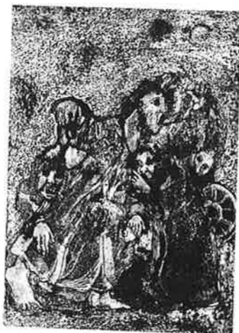
ROSA OLIVEROS D.P. (ベネズエラ) 15 APARECIDOS 26.5×19 銅版