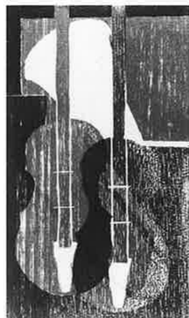
ANA-CRISTINA CAHIZ (ベネズエラ) 20 Violines 25×12 木版