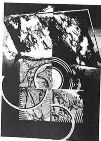
SUZANA FĂNTĂNARIU (ルーマニア) 9 MATTER 69.5×51.5 石版