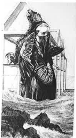
PAUL BASART (オランダ) 5 Exodus 80×60 シルクスクリーン