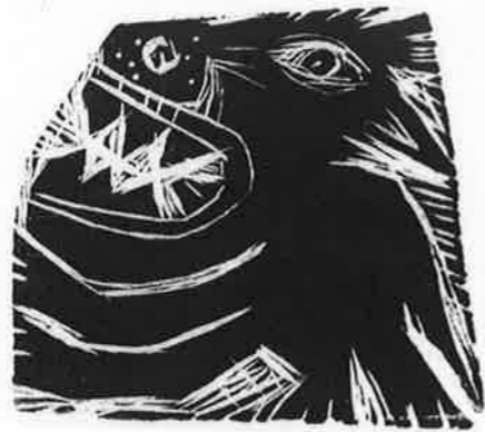
STEPHEN MUMBERSON (イギリス) 3 Avery Nice Dog 5×5 木版