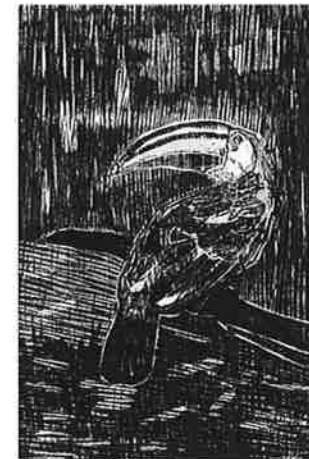
ERNESTINA PALLARES (コロンビア) 21 TUCAN 30×20 木版