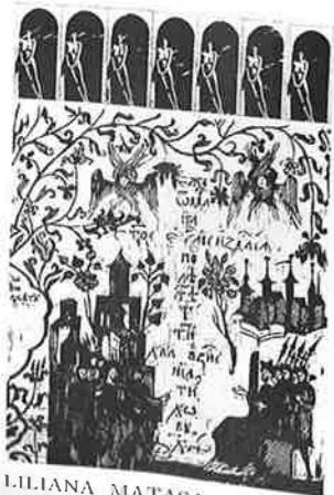
LILIANA MATASA (ベネズエラ) 13 AQUARIUM I 59.5×37 ミクストメディア