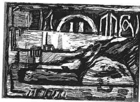
GABRIELA CHELLEW (チリ) 11 Serie Mar y Tierra, "Puerto" 31.5×44.5 木版