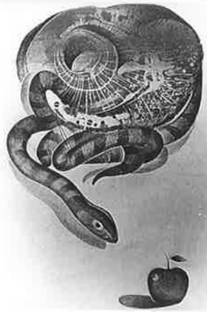
SHYAM SHARMA (インド) 1 THE APPLE 71×45 木版