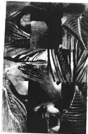
WENDY SIMON (カナダ) 7 DANSE MACABRE 70×50 銅版