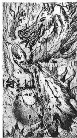
ELSA ELENA ESCOBAR (ベネズエラ) 16 DRAGON I 17×9 銅版