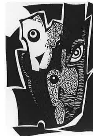
SARMA KARSIERE (ラトビア) 24 CAT-MAN 28×18 シルクスクリーン